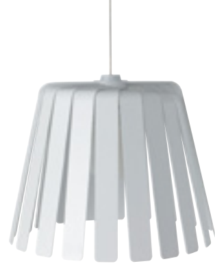
Lampe Landeron (o.). Inspiriert vom Mechanismus der Irisblende, schuf Atelier Oi 2011 diese Lampe für das von Alfredo Häberli kuratierte Atelier Pfister.