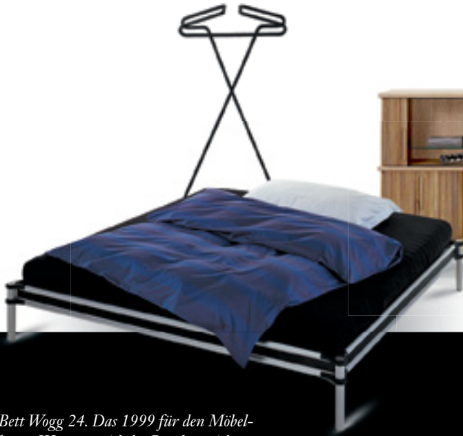
Bett Wogg 24. Das 1999 für den Möbelbauer Wogg entwickelte Bett lässt sich ohne Schrauben aufbauen. Zusammengehalten wird es von einem Spanngurt.