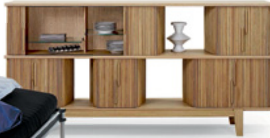
Sideboard Hommage und stummer Diener Prêles. Der Rollladenschrank wurde 2012 für Rötblisberger neu interpretiert, der Garderobenständer Prêles (ganz l.) ist Teil einer Kollektion für Atelier Pfister aus dem Jahr 2011.

«2015 realisierten wir 300 Projekte. Einige wickelten wir in zwei Wochen ab, andere dauern Jahre.»